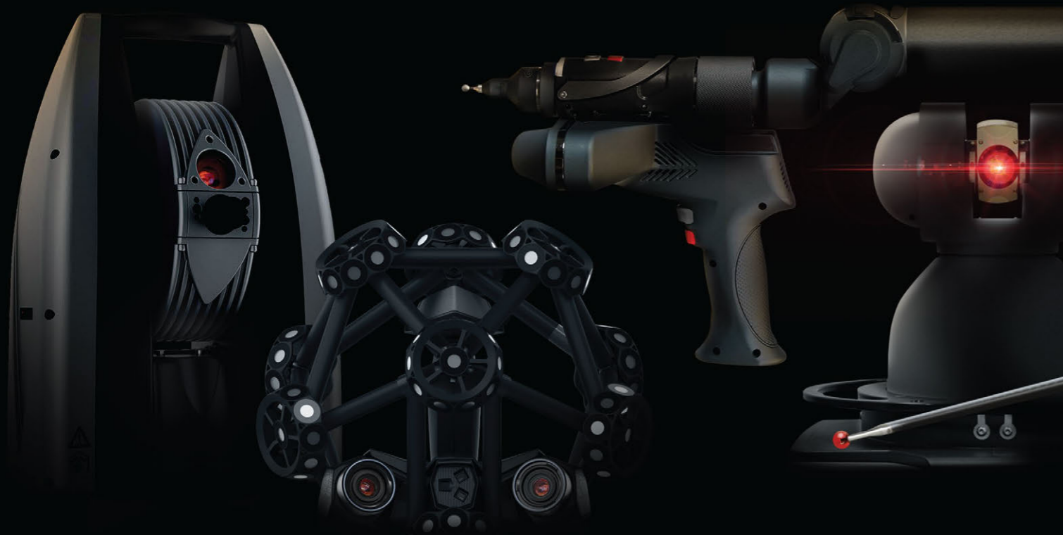
PLATE-FORME DE MÉTROLOGIE PORTABLE DE PREMIER PLAN

Réputé pour la puissance et la stabilité de ses interfaces matérielles directes, PolyWorks | Inspector offre un vaste ensemble de technologies de guidage qu'utilisent les plus grands fabricants d'équipement internationaux pour implanter des procédés de mesure efficaces, précis et répétables pour leurs dispositifs de métrologie portable.